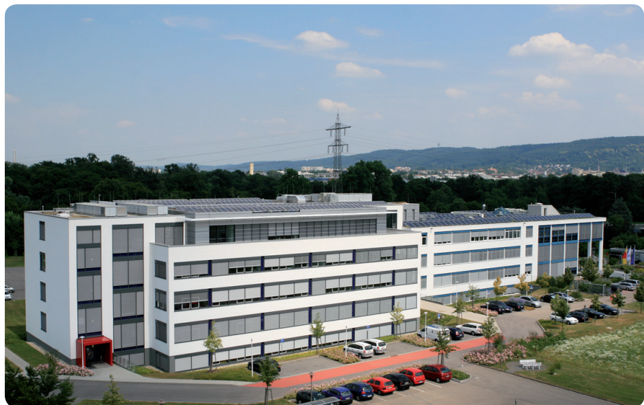
Hauptsitz der Bruker Optik in Ettlingen

Sie lernen die Funktionsvielfalt der MIR/NIR- und Raman-Spektroskopie unter fachkundiger Expertenanleitung kennen und deren Einsatz in Verbindung mit unterschiedlichen und optimierten Messtechniken. Da die Kurse digital stattfinden sind praktische Übungen in Software und an den Mess-Systemen leider nicht möglich, diese werden jedoch demonstriert.